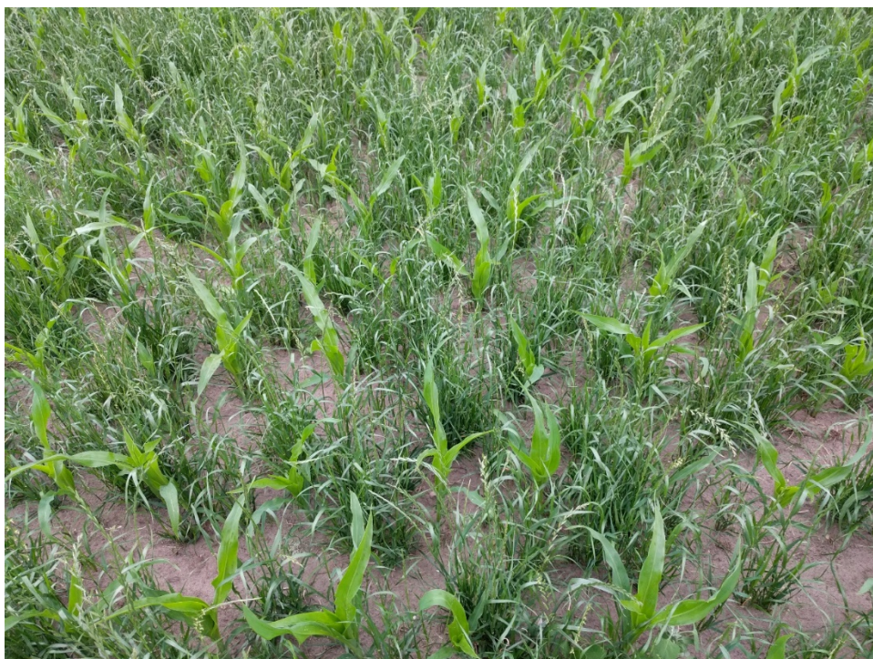
Figuur 2 Delta gezaaide mais en tegelijk een vanggewas ingezaaid op een zandgrond in Noord-Limburg 12 juni 2019.

Dit project is mede mogelijk gemaakt door