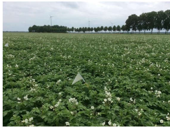
Zetmeelaardappel met Bokashi (23 juni)