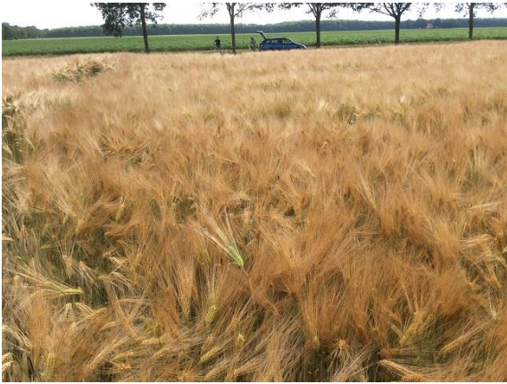
Gerst met ASL (23 juni)