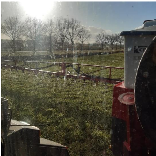
Figuur 1. Toediening van ASL op wintergerst op 5 maart.

Op 4 akkerbouwbedrijven wordt ASL ingezet bij de teelt van aardappelen en gerst op in totaal 5 percelen. De giften variëren van 30-50 kg N/ha. Een deel van het perceel wordt met de voor de teler gangbare meststof bemest het andere deel krijgt ASL. Gedurende het seizoen wordt het gewas gevolgd (en visueel beoordeeld) en wordt de opbrengstkwaliteit vastgesteld. De meststof wordt met de eigen veldspuit toegediend in de vorm van druppelen (stralen). De gebruikte ASL is afkomstig van Bio-energy Coevorden, maar vanuit praktische overwegingen is voor de pilot gebruikt gemaakt van een vergelijkbaar product van GMB uit Zutphen.