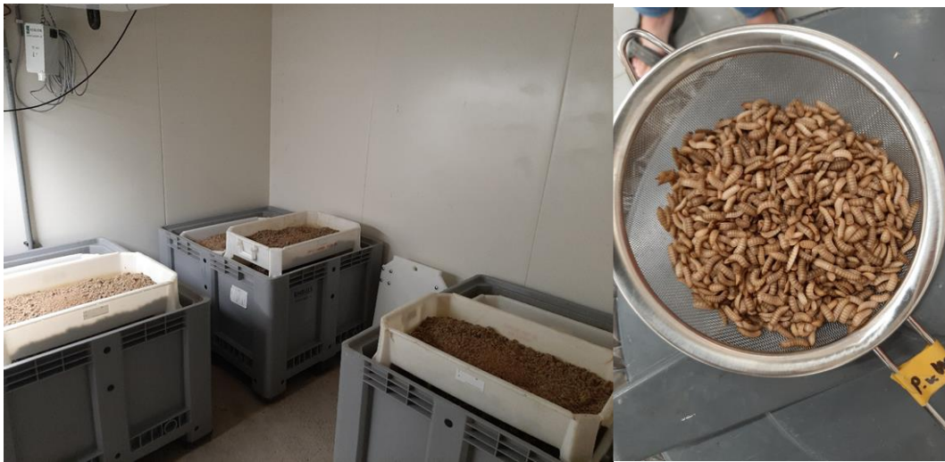
Foto. Larven van de zwarte soldaten vlieg of Black Soldier Fly (BSF) zetten reststromen om.

Organische reststromen kunnen door insecten en wormen omgezet worden, waarbij er zowel eiwitrijke nieuwe biomassa ontstaat (de insecten- en wormenbiomassa zelf), maar ook vermicompost en insectenfrass. Beide stromen worden al op beperkte schaal toegepast in de landbouw voor bemestings- en bodemkwaliteitsdoeleinden. Samen met voedingsindustrieën Avebe en Holland Malt zijn stromen geïdentificeerd die geschikt lijken voor omzetting door wormen en insecten. Eind maart wordt een proef ingezet door Wageningen UR ACRRES waarbij de larven (BSF) gaan groeien op een viertal verschillende stromen. Bepaald wordt in hoeverre de omzetting goed verloopt, hoeveel van de stroom opgebruikt wordt en hoeveel resterend substraat dan overblijft, of de larven weer goed gescheiden kunnen worden van het ontstane substraat en wat de bemestende waarde van het resterende substraat is. Insectenfrass zal ook in 1 van de veld demo's ingezet worden. Een proef met wormen wordt later dit jaar ingezet.