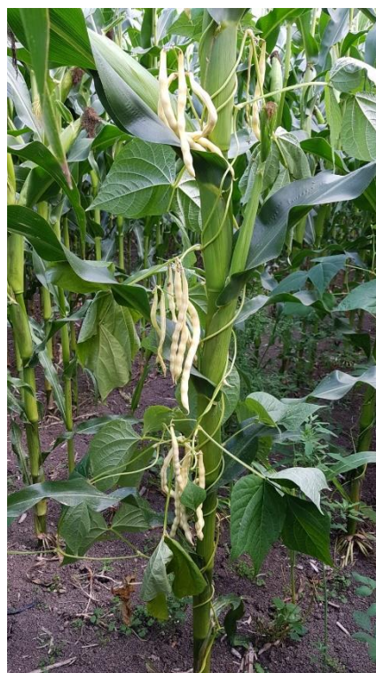
Foto. Maiszaaizaad met bonen (links) en bijna rijpe mais met stokbonen.