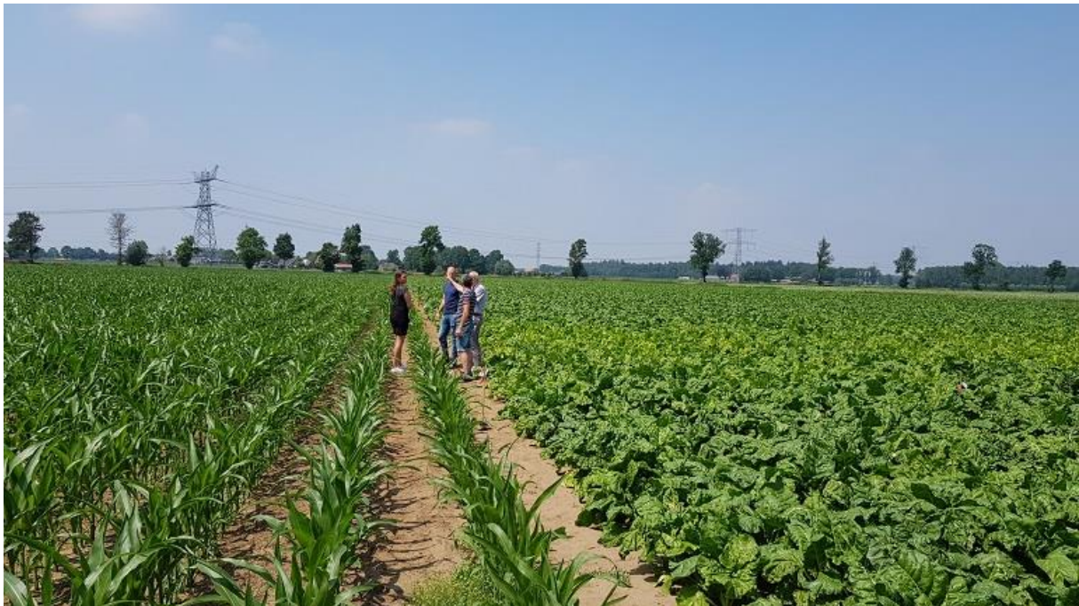
Figuur 5. Het te bemonsteren perceel in de Achterhoek (situatie 26 juni 2019).

Een aandachtspunt bij voederbieten (maar ook bij mais) is het risico van uitspoeling van gewasbeschermingsmiddelen. Nagegaan is of een meting mogelijk zou zijn. Begin oktober 2019 is op een locatie een meting uitgevoerd. Dit betrof een perceel in de Achterhoek (Figuur 5).