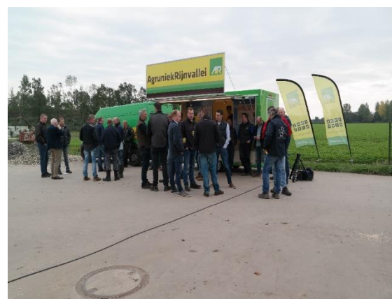
Figuur 4. Enkele impressies van de demodagen.