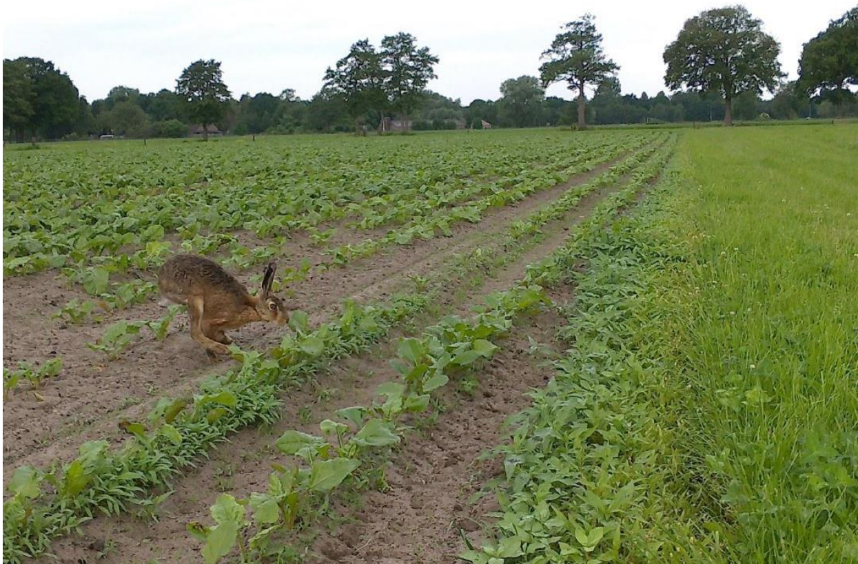
Figuur 2. Foto haas in voederbieten perceel te Wekerom op 6 juni.

Voor de grotere fauna zoals vogels en zoogdieren lijkt de teelt van voederbieten wat gunstiger, vooral als broed- en leefgebied zoals fazant, weidevogels, patrijs en haas. De vroege teelt en late oogst spelen daarin een belangrijke rol (veel dekking), net als de geringere hoogte van het gewas dan bij mais. Die hoogte speelt landschappelijk ook een belangrijke rol. Immers mais belemmert de vergezichten. Anderzijds kan mais ook ongewenst uitzicht (tijdelijk) verminderen.