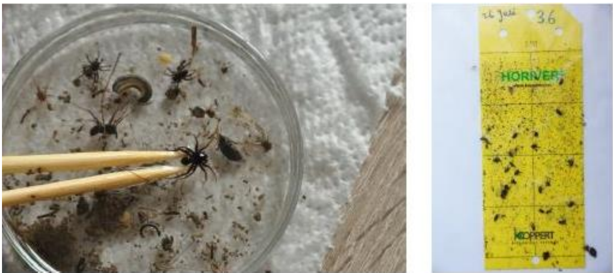
Figuur 1. Vangsten uit een bodemval (links) en plakval (rechts).

De vliegende insecten zijn met plakvallen (Figuur 1) gevangen in dezelfde monsterpunten. De plakvallen zijn gefotografeerd en geteld met een voor dit project ontwikkeld algoritme in ArcGis. Zowel de aantallen, grootteklasse en 'biomassa' zijn op deze wijze geschat. De uitkomsten hiervan sluiten globaal aan bij die van de bodemfauna: